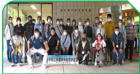
水産科学館で記念撮影！ 面舵一杯～取舵一杯～♪

9月27日(火)に自治会主催のレクリエーションに行ってきました！ 今年は宮古市の「岩手県立水産科学館」を見学してから、「シートピアなあと」で美味しい昼食と買い物を満喫♪ 楽しい1日となりました(▽)