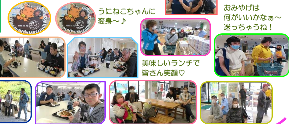
うにねこちゃんに 変身～♪