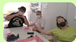
待ち時間の様子♪ お疲れ様でした。