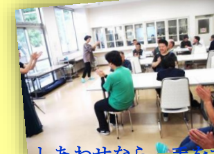
しあわせなら、手をたたこお