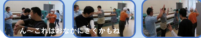
ん～これはおなかにきくかもね