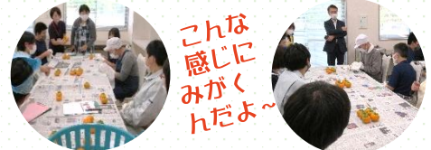
こんな 感じに みがく んだよ～

令和3年10月15日【金】かまいしワーク・ステーション多目的ホールにて、釜石祥雲支援学校の生徒さん11名とかまいしワーク・ステーションの利用者数名が参加し合同で行われました。 甲子柿の里生産組合長様より『育てる～収穫～商品にする』 釜石市産業振興部水産農林課産業振興係 櫻庭主任様より『釜石市の特産品「甲子柿」について』の説明を受け、その後みんなで甲子柿のみがき作業体験を行いました。釜石市の特産品を通して生徒さんたちと交流できたことはとても良い楽しい経験になりました。 今後も“釜石の甲子柿”一緒に盛り上げていけると嬉しいです。ありがとうございました。