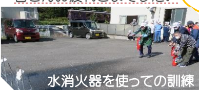
水消火器を使っでの訓練

避難訓練を今回は消防士立ち合いで行いました。職員玄関から出火したという想定で行いましたが、みんなてきぱきとスムーズに行動できていました。消防士さんからも「上手にできました」とお褒めの言葉を頂きました。 日ごろの訓練がいざというときに役に立ちます。これからも真剣に取り組みましょう。皆さんお疲れさまでした。