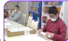
シュリンク科も一緒に作業しました！