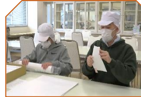
お疲れさまでした！