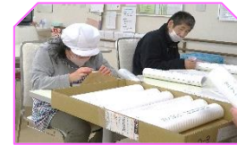
クリーニング科の皆さんです。