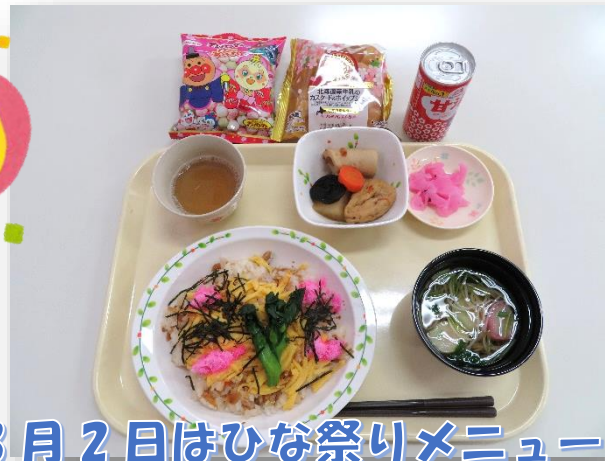
3月2日はひな祭りメニュー!

~しごとのはなし~ ワークでは「ほうこく・そうだん」がだいじ 「ほうこく」は、職員や先輩にしごとの状況をつたえることで、「そうだん」は職員や先輩にアドバイスをもらうこと。 どちらも仕事の不安をへらし、まわりとの関係をよくする効果があります。 どんどんほうこく、そうだんしましょう。